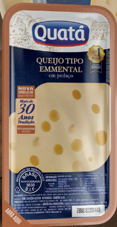
Queijo Tipo Emmental Fracionado de 180 a 220 g Código 1119