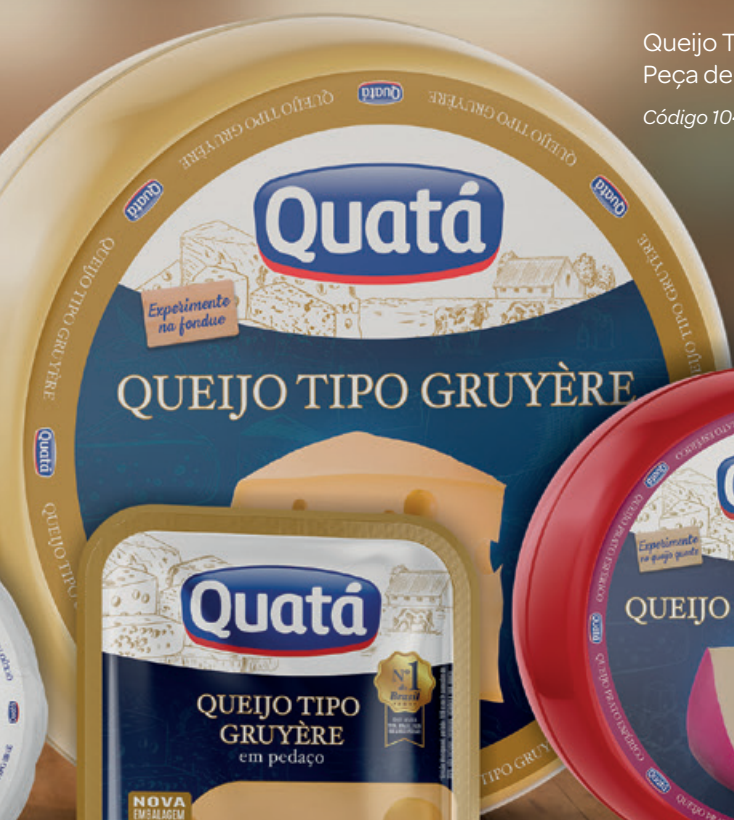
Queijo Tipo Gruyère Peça de 12 Kg Código 1046