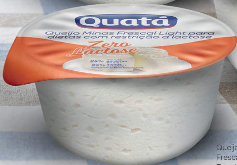
Queijo Minas Frescal Light Zero Lactose 500 g Código 1157