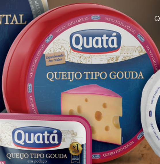
Queijo Tipo Gouda Peça de 3 Kg Código 1026