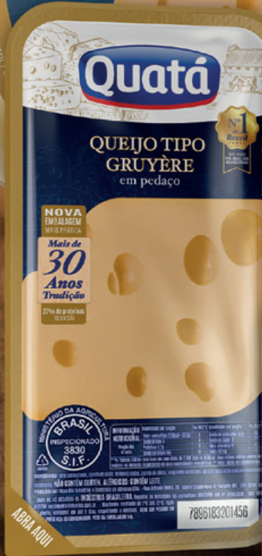
Queijo Tipo Gruyère Fracionado de 200 g Código 1122