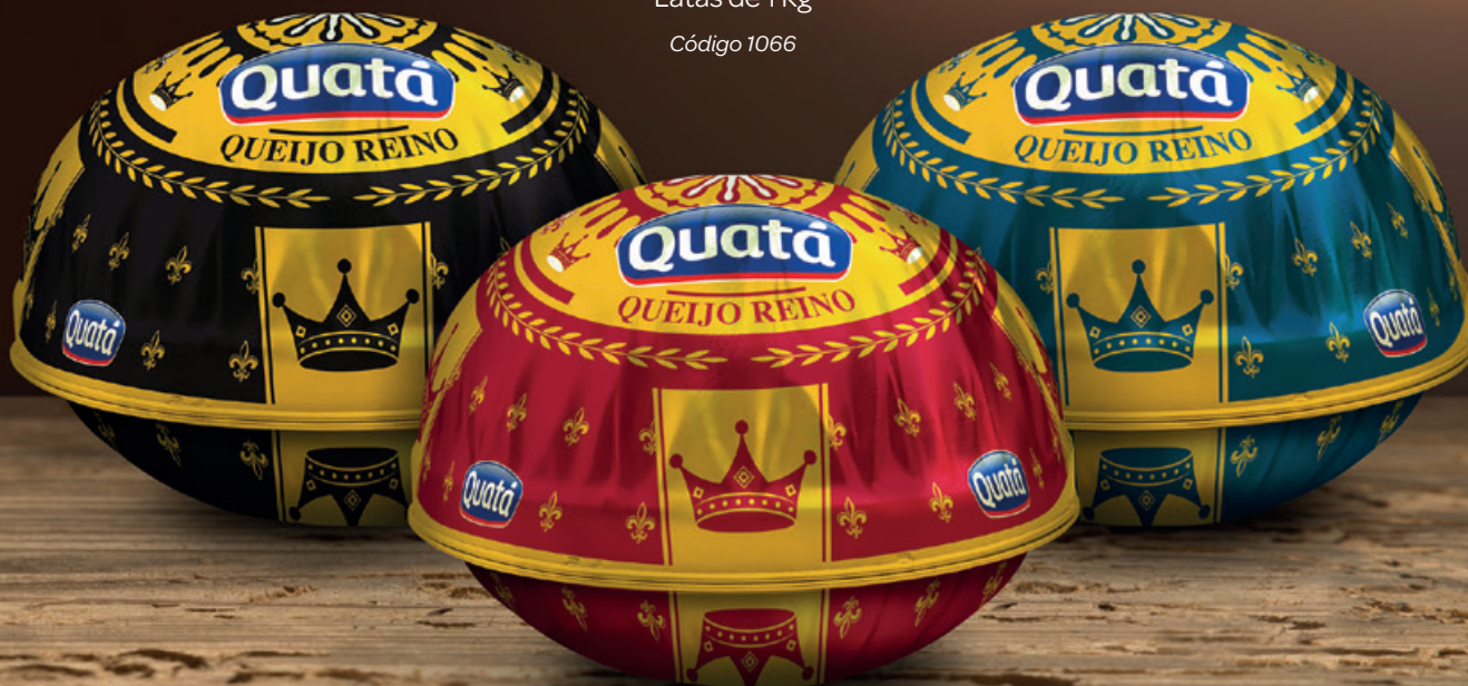
Queijo Reino Latas de 1 Kg Código 1066