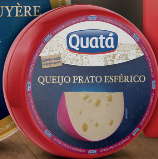
Queijo Prato Esférico Peça de 2 Kg Código 1028