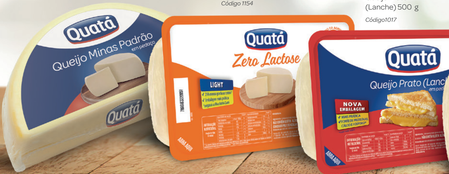
Queijo Prato (Lanche) 500 g Código 1017