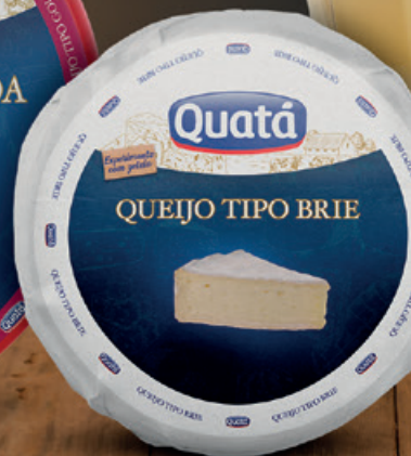
Queijo Tipo Brie Peça de 1 Kg Código 1108