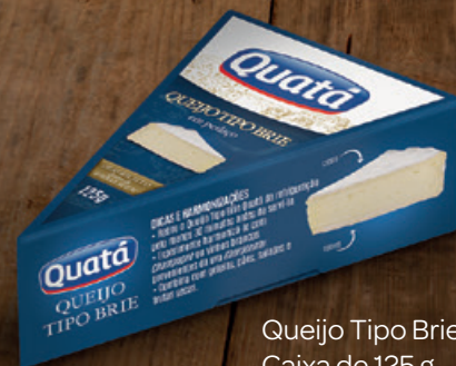
Queijo Tipo Brie Caixa de 125 g Código 1113