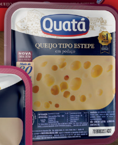
Queijo Tipo Estepe Fracionado de 200 g Código 1127