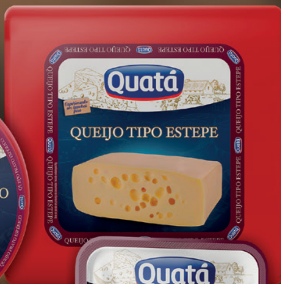
Queijo Tipo Estepe Peça de 6 Kg Código 1019