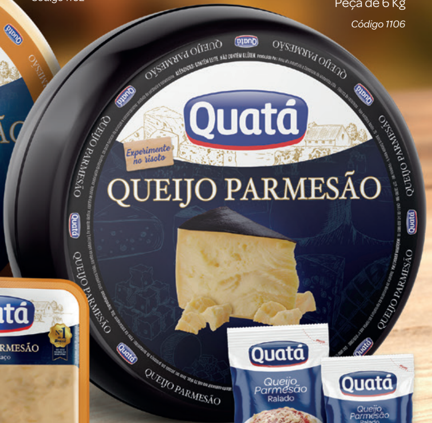
Queijo Parmesão Capa Preta Peça de 6 Kg Código 1106