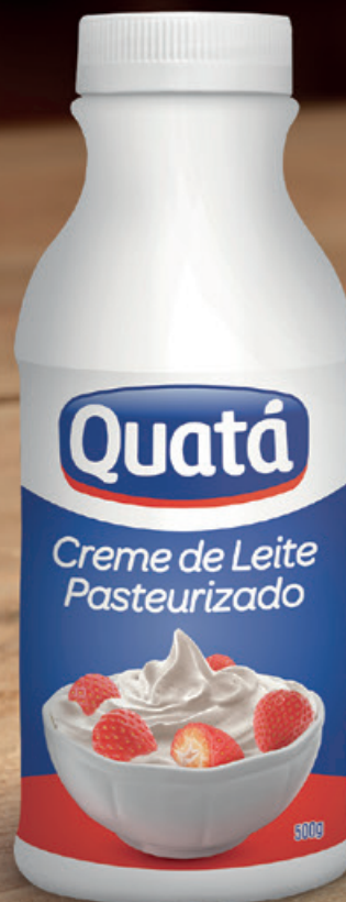
Creme de Leite Pasteurizado 500 g e 1,01 Kg Códigos 6222 e 6225