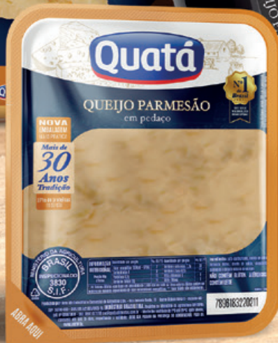
Queijo Parmesão Fracionado 300 g Código 1042