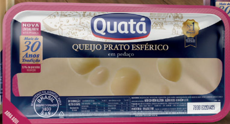
Queijo Prato Esférico Fracionado de 200 g Código 1123