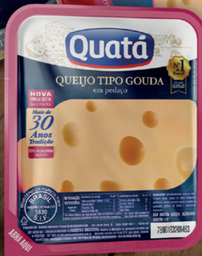
Queijo Tipo Gouda Fracionado de 200 g Código 1121