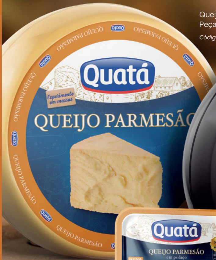
Queijo Parmesão Peça de 6 Kg Código 1102

MATURAÇÃO: 180 DIAS DE MATURAÇÃO, GARANTINDO O SABOR E A PICÂNCIA.