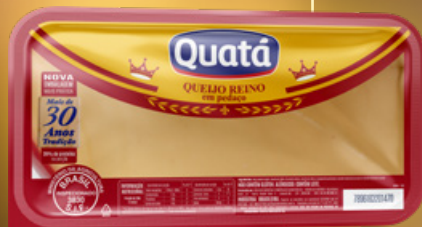
Queijo Reino Fracionado de 180 g Código 1124

EMBALAGEM ESPECIAL: MUITO APRECIADO NO NORDESTE, É, TRADICIONALMENTE, USADO PARA PRESENTEAR EM FESTAS.