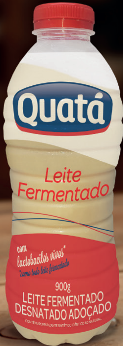
Leite Fermentado 900 g Código 8701

Certeza de boas receitas: com 35% de gordura, propicia um excelente rendimento. Perfeito para chantilly.