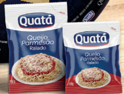
Queijo Parmesão Ralado 50 e 100 g Códigos 1022 e 1027