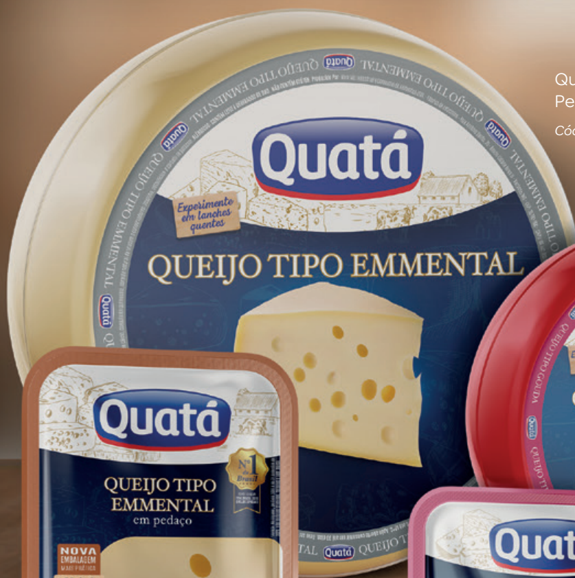
Queijo Tipo Emmental Peça de 12 Kg Código 1085

Com respeito às necessidades dos diferentes consumidores da categoria, a Quatá tem um amplo portfólio, podendo ser fracionado de fábrica ou no ponto de venda.